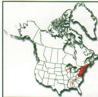
? Localisation imprécise