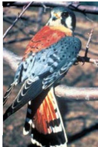
Crécerelle d'Amérique --- Photo : U.S. Fish & Wildlife Service