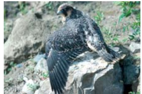
Faucon pèlerin immature --- Photo : U.S. Fish & Wildlife Service

La Buse à queue rousse ( Buteo jamaicensis ) se distingue par sa grande envergure d'ailes, son cri perçant et la couleur des plumes de sa queue. Elle niche dans des boisés, mais se perche habituellement en bordure, guettant les petits mammifères avant de fondre sur eux. Véritable version miniature du Faucon pèlerin, la Crécerelle d'Amérique ( Falco sparverius ) s'attaque à une multitude d'insectes et de rongeurs nuisibles pour l'homme. La queue et les ailes grandes ouvertes, elle fait du sur place pour repérer ses proies. C'est un rapace diurne qui niche dans des cavités d'arbres. Perchée sur un poteau ou un fil, sa posture droite et ses petits hochements de queue sont facilement reconnaissables.