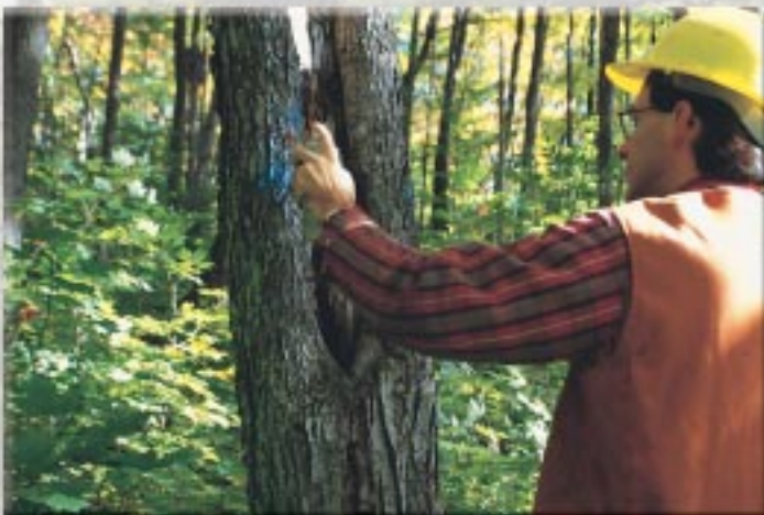
Dans une coupe de jardinage, on récolte tout au plus un arbre sur trois. On laisse sur place les arbres les plus sains et de tous les âges

Dans un premier temps, on doit marquer individuellement les arbres à couper afin de dégager les sujets les plus prometteurs ou plus petits. C'est l'étape qu'on appelle « marquage » ou, plus communément, « martelage ». On choisit de couper d'abord les arbres qui sont malades ou difformes et dont les parties saines peuvent être utilisées par les usines. Ensuite, on récolte les arbres qui nuisent aux jeunes tiges d'avenir et, finalement, les vieux arbres sains qui ne grandissent plus. Cette coupe comprend, tout au plus, le tiers des arbres d'un secteur donné.