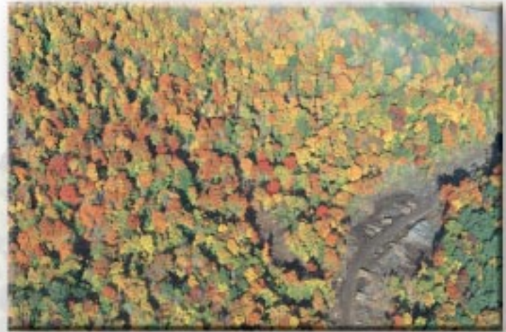
Une coupe de jardinage où on voit les trouées laissées par la coupe des arbres

Il est important de souligner qu'on peut utiliser cette méthode de coupe seulement dans les peuplements dont les arbres ont la capacité de pousser à l'ombre de leurs voisins (arbres dits « tolérants »). Ainsi, la coupe de jardinage se fait dans une forêt composée uniquement d'essences feuillues ou mélangées, là où dominant des feuillus