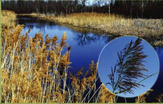
Roseau commun - Phragmites australis

Les plantes exotiques envahissantes affectent l'environnement de plusieurs façons.