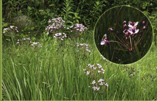
Butome à ombelles - Butomus umbellatus