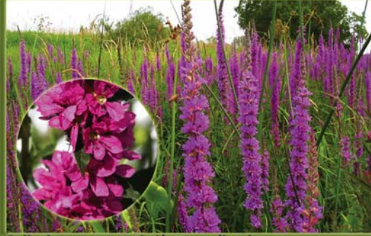
Salicaire pourpre - Lythrum salicaria