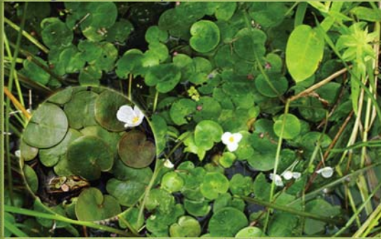
Hydrocharide grenouillette - Hydrocharis morsus-ranae