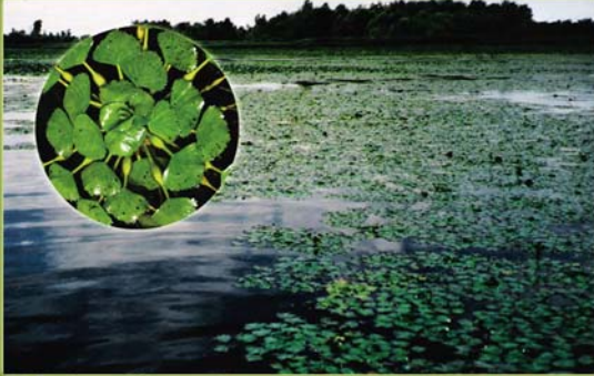
Châtaigne d'eau - Trapa natans

En modifiant l'habitat, les plantes envahissantes perturbent à la fois la flore et la faune locales.