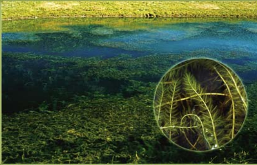
Myriophylle à épi - Myriophyllum spicatum