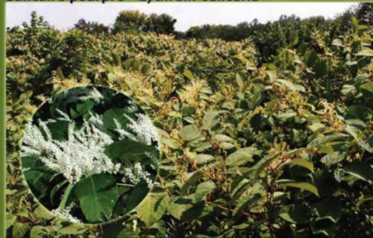
Renouée japonaise - Fallopia japonica