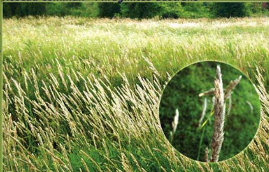
Alpiste roseau - Phalaris arundinacea