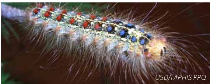
USDA APHIS PPQ