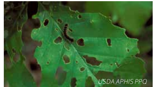
USDA APHIS PPQ

Un arbre en bonne santé a peu de risque de mourir, et ce, même s'il est défolié à 100 %. Par contre, les risques augmentent si la défoliation survient plusieurs années consécutives ou si l'arbre est affaibli ou stressé. Par exemple, une forte sécheresse peut être un facteur aggravant. De plus, les conifères sont plus sensibles; une année de perte de feuilles suffit à faire mourir de nombreux individus.